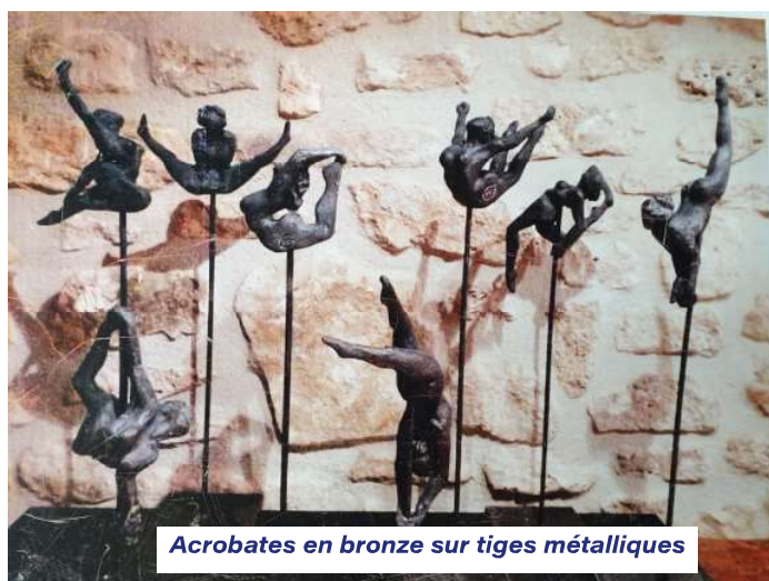
Acrobates en bronze sur tiges métalliques

Elle y a obtenu de très nombreuses récompenses comme le Prix de la Création au Salon d'Art Contemporain de SENLIS ou le Prix Conti de la Sculpture au Château Conti de l'Isle-Adam.