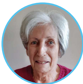
Lucie CAMATTE Dessin / Peinture Aquarelle