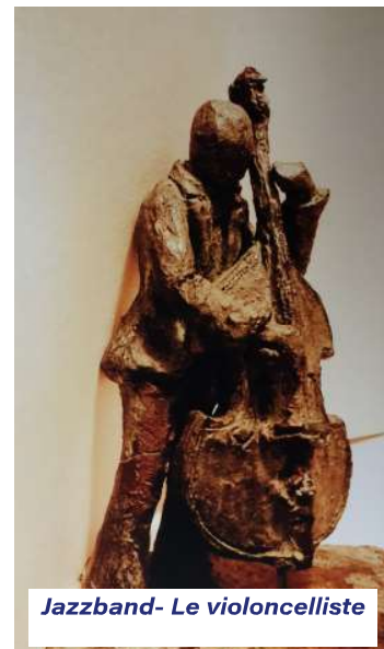
Jazzband- Le violoncelliste